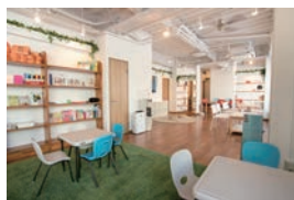
内装イメージ (写真はウィズダムアカデミー三鷹校になります)

東京都国分寺市東恋ヶ窪 1-280-4 ザ・パークハウス国分寺四季の森 II棟内